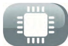
Techonologie Fuzzy Logic

Bouton de sécurité enfant: Lorsque ce mode est sélectionné, toutes les fonctions sont bloquées, sauf "Marche/Arrêt".