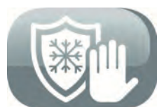
Fonction hors gel

Ouverture main propre: Une nouvelle façon de dévisser le bouchon de réservoir sans se salir les mains.