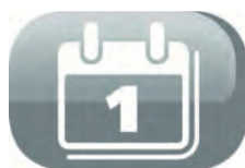
Programmation sur 24h

Arrêt après 3h de fonctionnement : Fonction permettant de faire fonctionner l'appareil durant 3h.