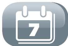
Programmation sur 7 jours