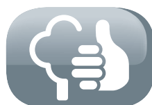
Respectueux de l'environnement (CO 2 neutre)