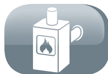
2 évacuations au choix