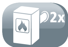
Chauffe 2/3 pièces